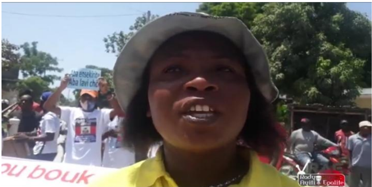
Pèp ki nan lari k ap reklame chanbatman sistèm nan

b) Genyen ti boujwa yo ak you franj nan oligachi a ak klas politik tradisyonèl la ki swete depa Ariel HENRY . Ak tou, ti boujwa, politisyen rat do kale yo, plis Nazyon Zini, yo swete pou eleksyon fèt nan you tan rezonab pou debloke peyi a. Tankou, ansyen Senatè Sid, Jean Marie Junior SALOMON se youn nan politisyen tradisyonèl ki nan lari a k ap mande depa Ariel . Revè meday, sa, se pako solisyon tout bon mas pèp la ap chache a, mas pèp la pentad ak mòd bouyon rechofe sa yo ki pa janm rezoud bezwen li yo. Ki donk, Mòd solisyon sa yo toujou fini nan benefis politisyen sa yo, dirijan san vègòd, ti boujwa, oligaji, enpeyalis la.