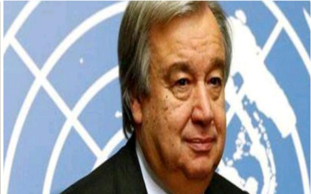
Sekretè jeneral Loni, Antonio GUTERRES