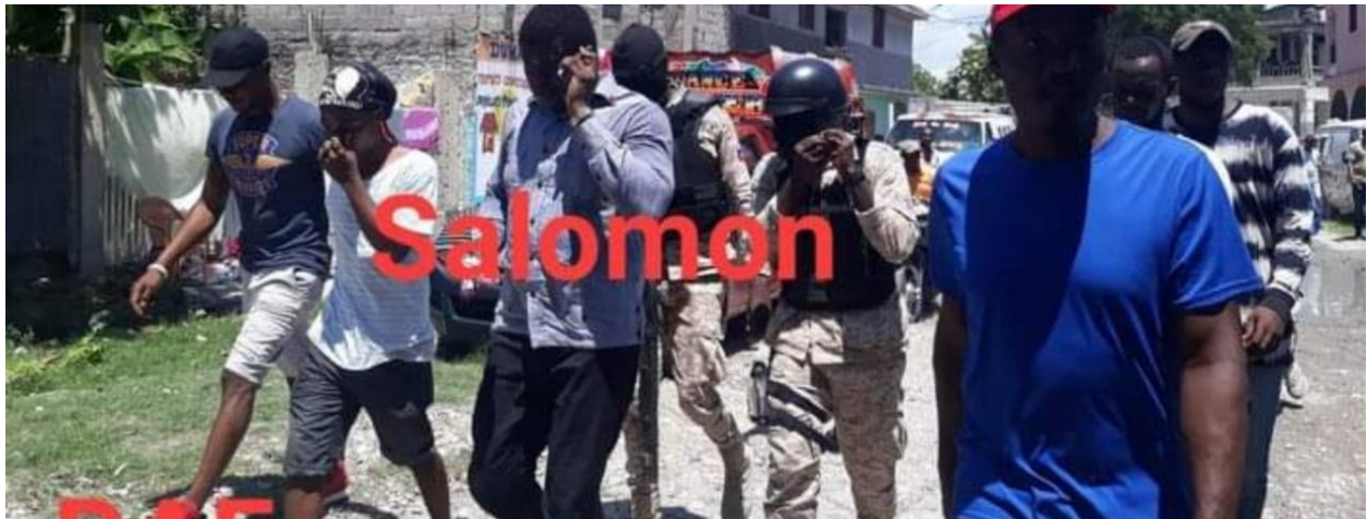
Ansyen Senatè Sid, Jean Marie Junior SALOMON

b) Genyen ti boujwa yo ak you franj nan oligachi a ak klas politik tradisyonèl la ki swete depa Ariel HENRY . Ak tou, ti boujwa, politisyen rat do kale yo, plis Nazyon Zini, yo swete pou eleksyon fèt nan you tan rezonab pou debloke peyi a. Tankou, ansyen Senatè Sid, Jean Marie Junior SALOMON se youn nan politisyen tradisyonèl ki nan lari a k ap mande depa Ariel . Revè meday, sa, se pako solisyon tout bon mas pèp la ap chache a, mas pèp la pentad ak mòd bouyon rechofe sa yo ki pa janm rezoud bezwen li yo. Ki donk, Mòd solisyon sa yo toujou fini nan benefis politisyen sa yo, dirijan san vègòd, ti boujwa, oligaji, enpeyalis la.