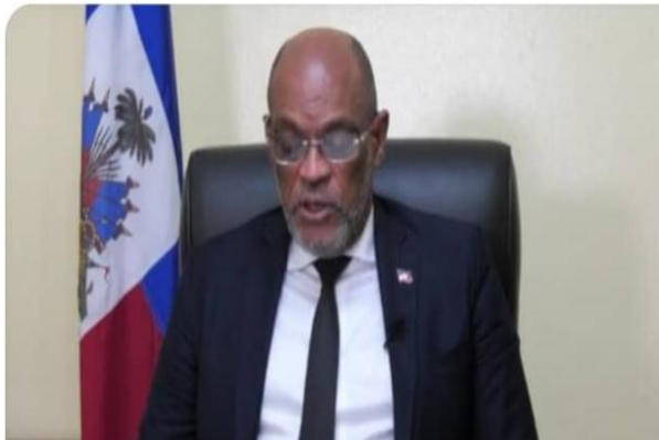
Preminis, Ariel HENRY

respekte ak aplike prensip dwa moun yo nan peyi a, pou pwoteje dwa moun yo ke yo pa fè sa osinon yo menm ankò vyole yo a.